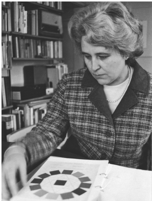
Vorbereitung zum Farbenlehr- unterricht

Und, und, und... Und dieses angespannte Leben forderte einen hohen Preis von mir. Ich erkrankte an Krebs mit allen Folgebedingungen. Es war eine harte Zeit. Noch heute.